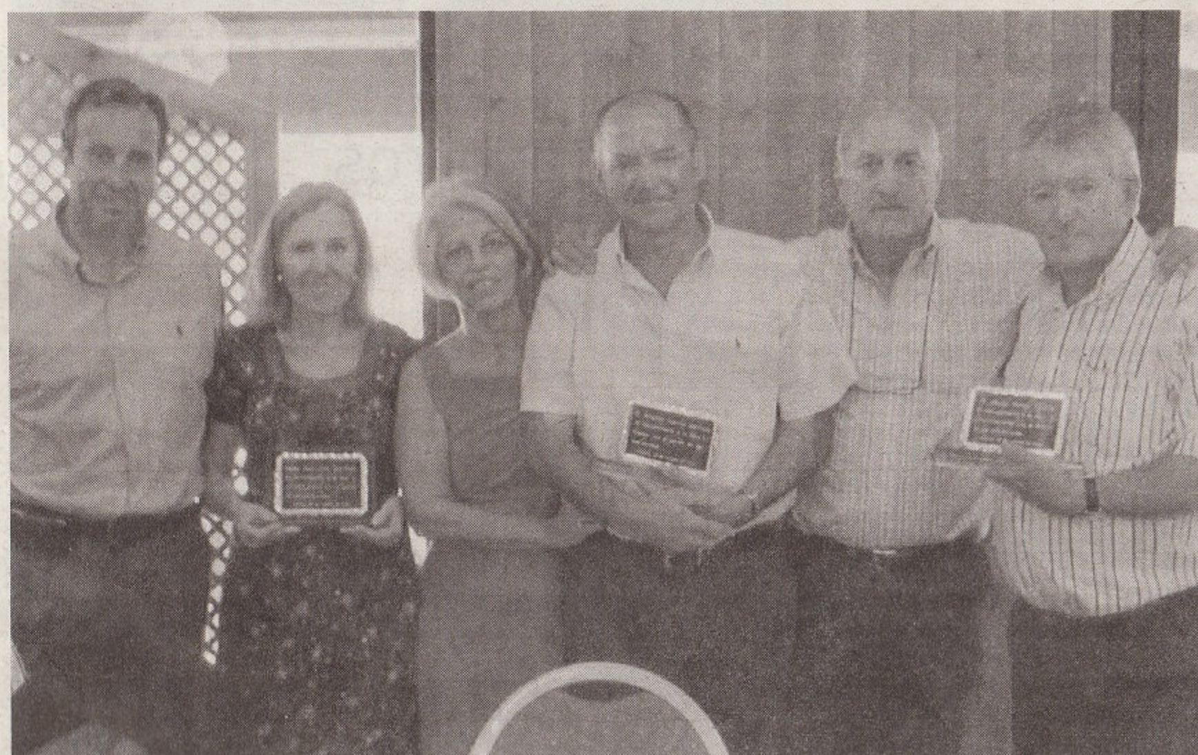
Algunos de los homenajeados por las autoescuelas.