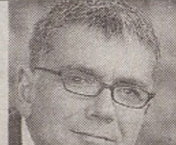
Juan Ramón Lucas (55 años) Periodista español. Uno de los referentes en la profesión.