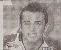
Héctor Barberá (27 años) Piloto de motociclismo español que corre en MotoGP.

ENVÍENOS UNA FOTO ORIGINAL del homenajeado con sus datos y el mensaje que quiere que aparezca a Diario de Almería , Sección Agenda, Comercial Oliveros, C/ Maestro Serrano, 9, Primera planta. 04004 o bien a vivir@elalmeria.es .